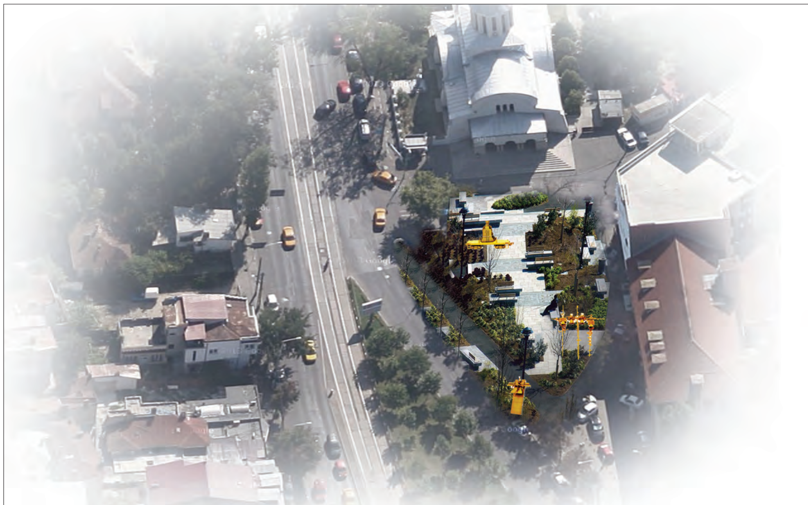
sus: propunere de ansamblu, fotomontaj jos: propunere, detalii