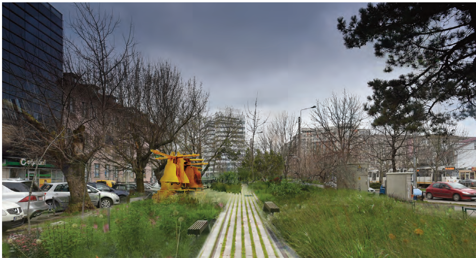
up: overall proposal, photomontage below: proposal, detail