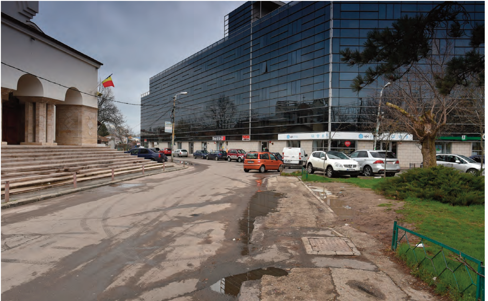
imagini ale existentului images of the existing