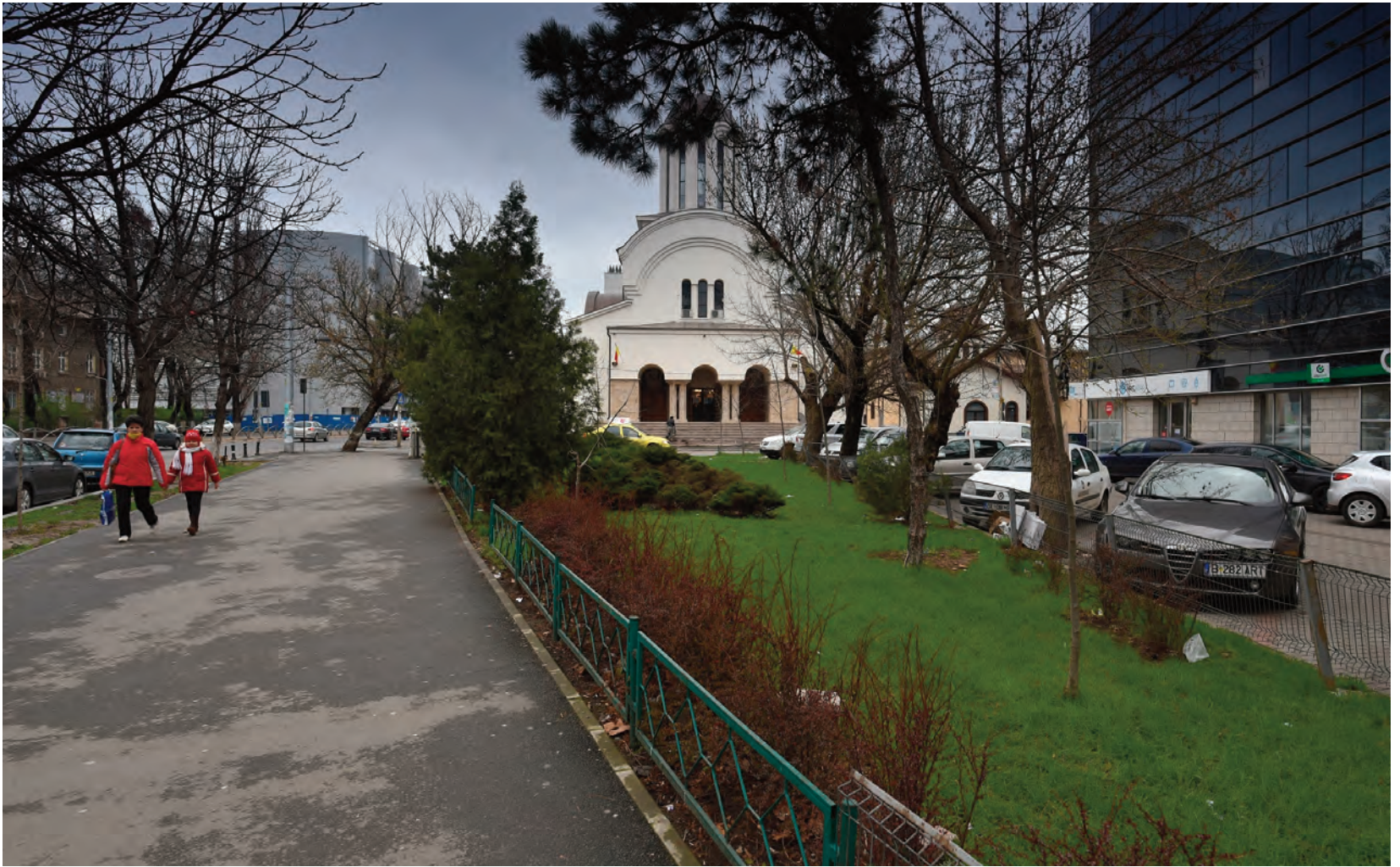
imagine a existentului de la nivelul solului; jos, perspectivă aeriană image of the ground level existing; below, aerial perspective