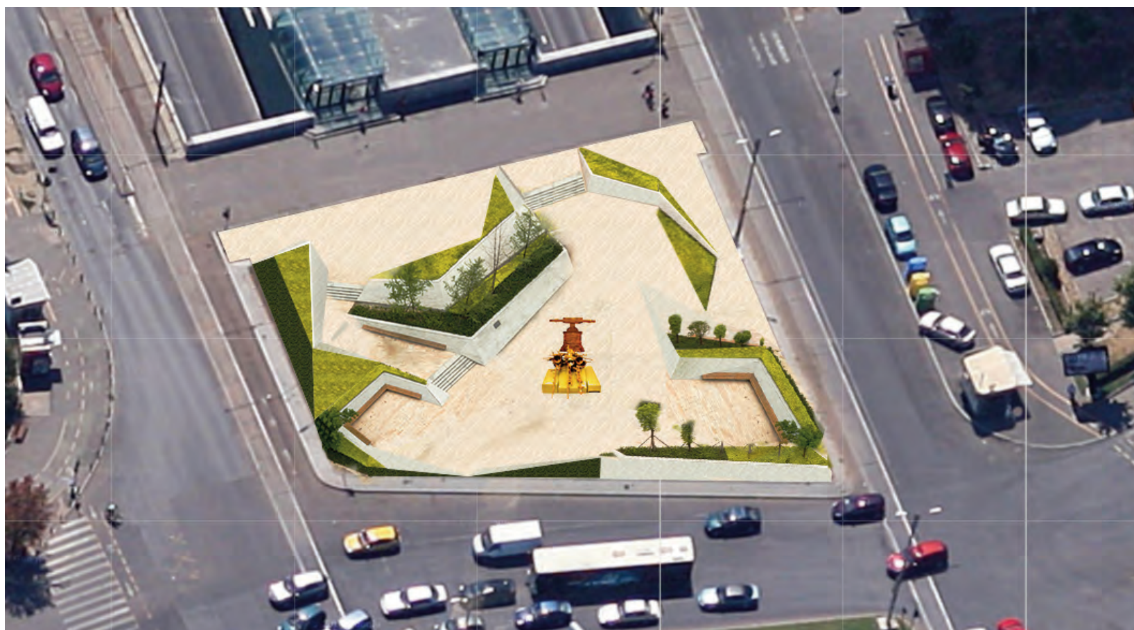
amenajare cu instalație-clopot a scuarului din vecinătatea intrării la Metrou (Stația Muncii) improvement with the bell-tower installation of the square near the entrance to the Metro (Muncii Station)