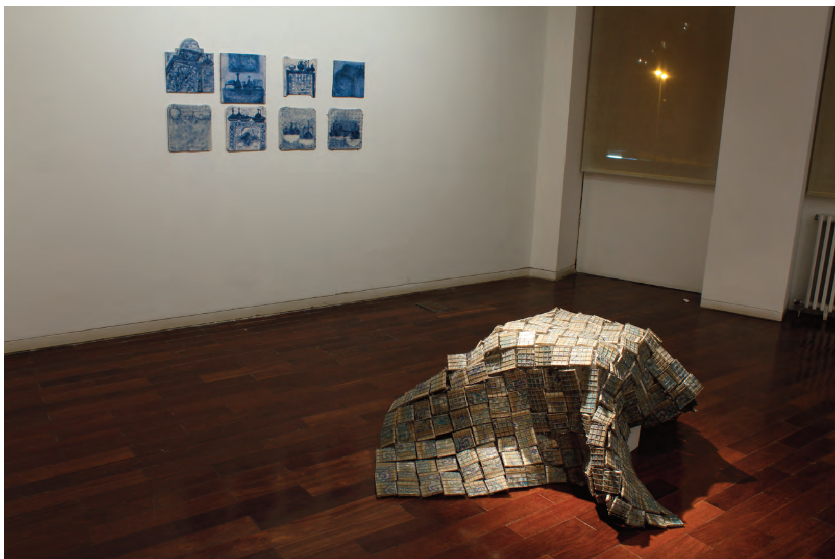
instalație din obiecte de ceramică, imagine din expoziție, autor Cristina Bolborea installation of ceramic objects, image from the exhibition, author Cristina Bolborea

In itself, the object is customized by tone chromatics and versatility as the principle of exposure. These two attributes could be emphasized, in the case of presumed integration in the city, by the availability of joints (guessing the connections and the correspondence between ceramic pieces) and fluidity. A proposal to integrate into the contemporary by inviting the neighbour to contemplate and touch, to dialogue and (self) interrogation.