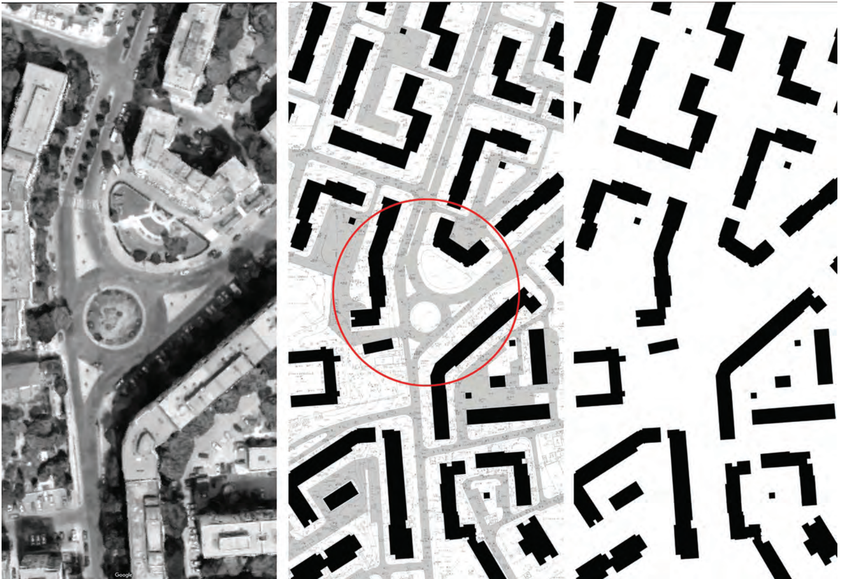
imagine din satelit a zonei studiate; plan pagina din dreapta: situație existentă