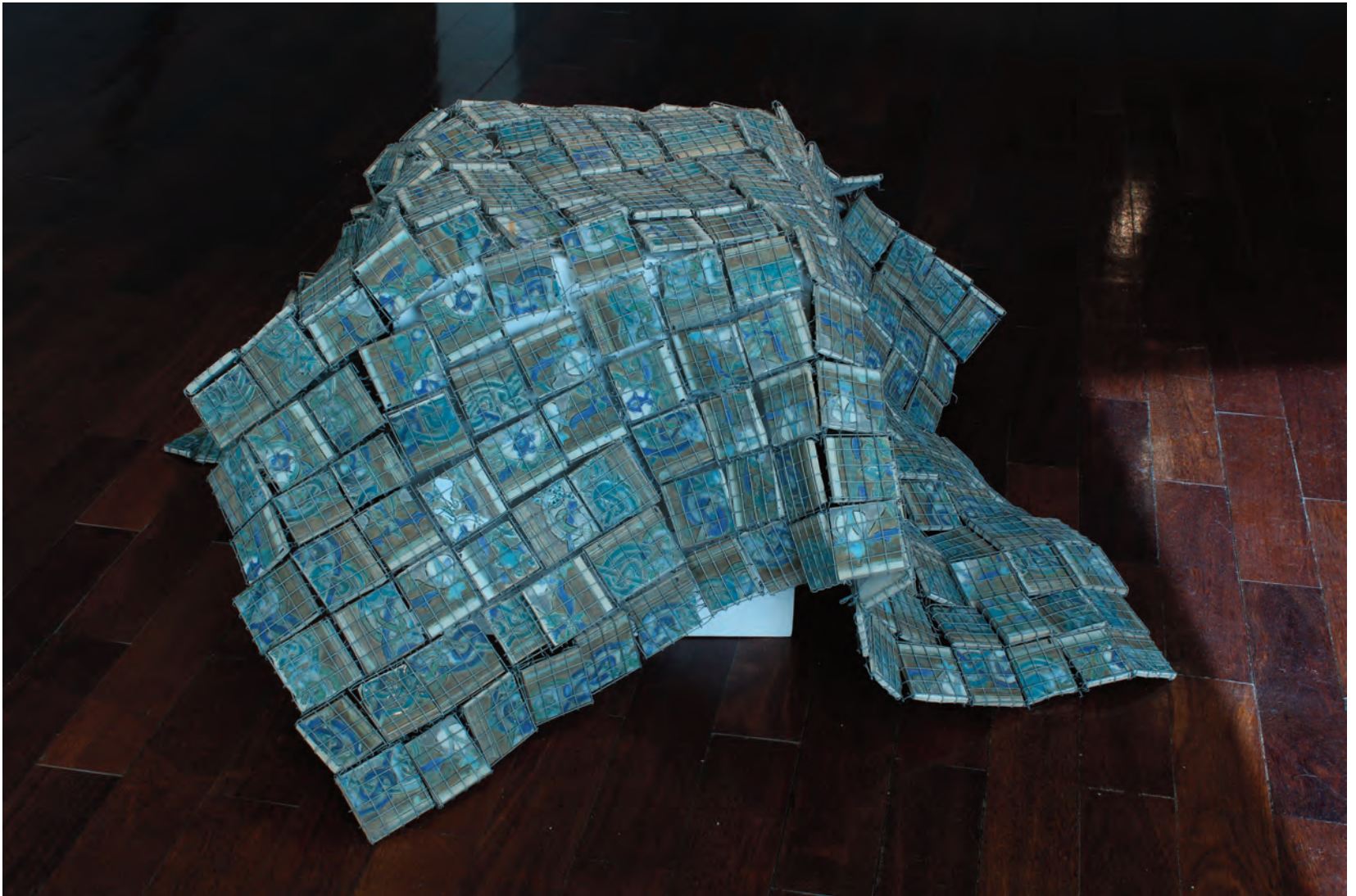
instalație din obiecte de ceramică, autor Cristina Bolborea installation of ceramic objects, author Cristina Bolborea

În sine, obiectul se particularizează prin cromatică tonală și prin versatilitate, ca principiu de expunere. Aceste două însușiri ar putea fi sporite, în cazul unei prezumtive integrări în oraș, de disponibilitatea la articulare (ghicim prinderi și corespondențe între piesele de ceramică) și de fluiditate. O propunere de integrare în actualitate prin invitația la contemplare și tactil, la dialog și (auto-)interogație.