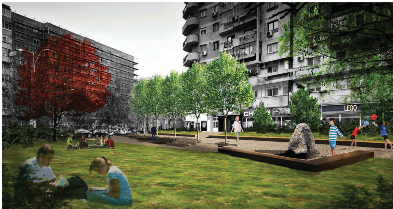
propunere în sit, fotomontaj site proposal, photomontage