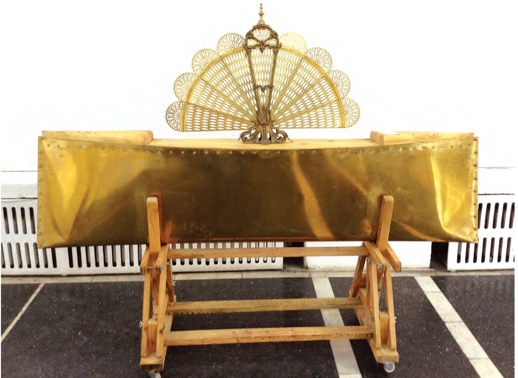
obiect -„vapor” în expoziție „ship-like”-object in the exhibition