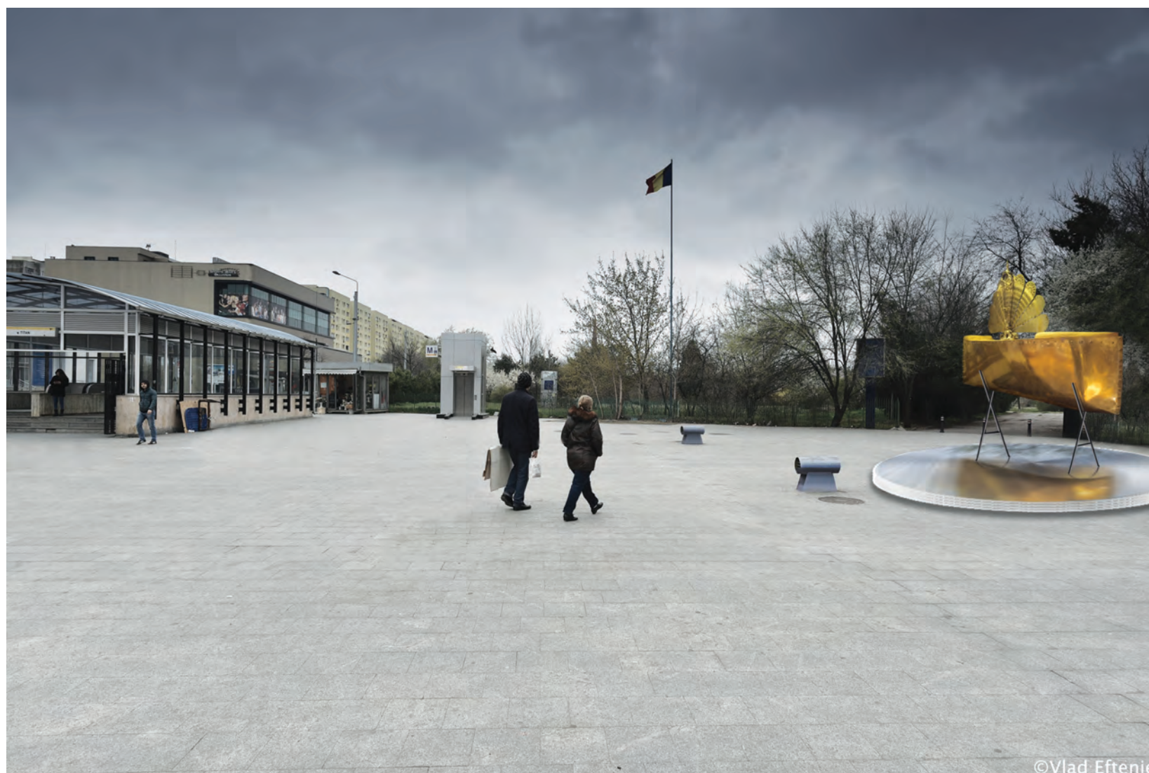
propunere pe plan (pagina din stânga) și randare virtual proposal on plan (left page) and rendering